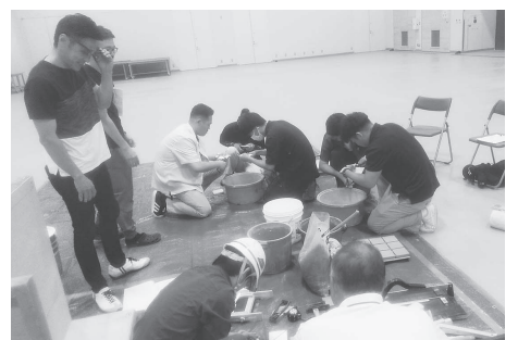
2級技能講習実技指導の様子

講じていました。施工に対 する知識ばかりでなく技能 を勉強しようとするところは とても良いことだと思います。 最近では手前から説明し ますが、最初は墨出し の加工・張付けとすすみ 床タイル下地作りと磁器質 タイル張りで完成という手 順です。試験本番では、こ の作業を2時間半〜3時間 刃を直角に素早く筋を入 れ、テコの原理で、両手で 張つたら今度はバサバサモ ルタルで下地を作り、ノロ (セメントを水で溶いた液 体)をまいて、床に100 角タイルを張っていくので すが、受講者を見ていると 砂とセメントの比率や水を 張つたら今度はバサバサモ ルタルで下地を作り、ノロ (セメントを水で溶いた液 体)をまいて、床に100 角タイルを張っていくので すが、受講者を見ていると 砂とセメントの比率や水を