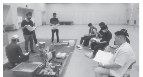
2級技能講習の説明

東京都の令和5年度タイ ル張り技能検定実技講習会 が6月18日(日)午前9時 より午後4時まで東京都立 城東職業能力開発センター で開催されました。当日2 級実技講習の練習風景を見 学させていただきました。 2級実技検定講習会の参 加者は6名、全員が職人さ んかと思いきやタイルの施 工管理者(番頭さん)も受 講していただきました。