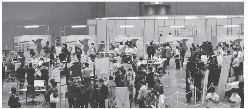
昨年の大会の様相

【競技時間】 標準時間…9時30分～12時00分(打切時間…10時30分) ◆第1日目競技時間(作業時間…7時間) 競技8時30分～12時00分 ◆第2日目競技時間(作業時間…3時間30分※打切までの1時間含む) ◆大会概要および競技課題の詳細は中央職業能力開発協会ホームページで公表されています。 http://www.javda.or.jp http://https://www.javda.or.jp