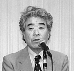
東夕協・館理事長