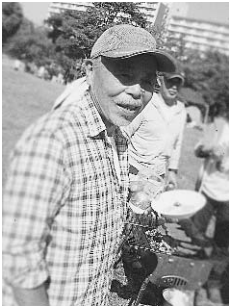
バーベキューを楽しみながら懇親を