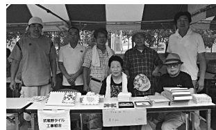
武蔵野タイル工事組合の皆さん