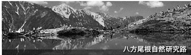
八方尾根自然研究路

北アルプス白馬連峰の唐松岳(2,696m)付近の稜線から延びる八方尾根。ゴンドラとリフトを乗り継ぐ八方アルペンラインの終点、八方池山荘から八方池までが定番のトレッキングコースとして親しまれています。白馬三山や五竜岳といった北アルプスの山々が間近に迫る素晴らしい眺望コースで、健脚の方は天気良ければ標高2,060mの八方池の水面に白馬連峰の山々が映るとも神秘的な光景に出会えるでしょう。