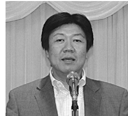
武蔵野・塩原組合長