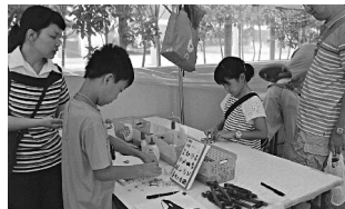
親子でモザイクに取り組み！