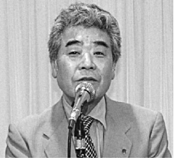
東夕連・館理理事長