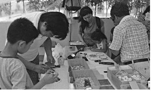
猛暑のなかでも作品づくりに夢中！