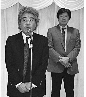
東夕連・館副会長