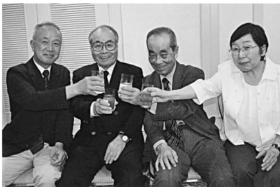
楽しい歓談と交流が続いた！