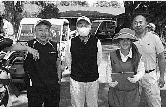
各組に分かれてスタート

9時56分より1組目から6組目まで順番に和気あいあいとしたスタートです。このハンデは皆様にはチャンスがあると思います。その中で私の馬券予想も外れ、それが実証されました。