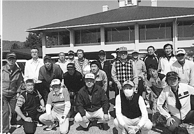
参加者全員で記念撮影！