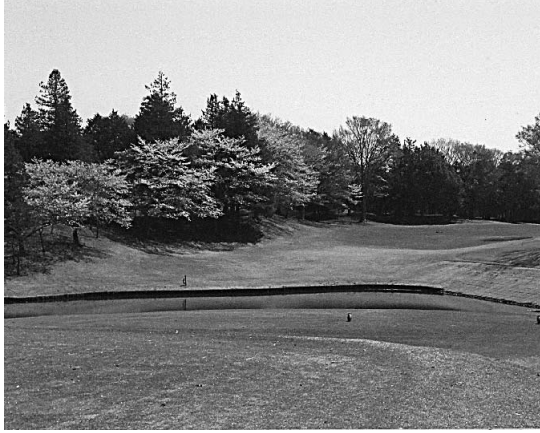
日本庭園風の緑の美しいコース