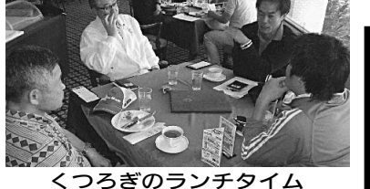
くつろぎのランチタイム

先般、主催の「技能五輪・アビリンピックあいち大会2014推進協議会」から今年大会の開催が次のように公表された。