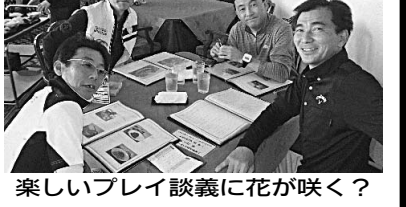
楽しいプレイ談義に花が咲く？