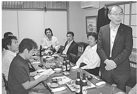
東夕連・矢部会長の挨拶