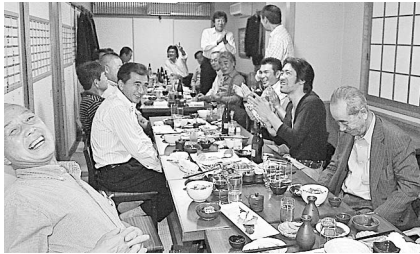
東夕連・塩原副会長の締め