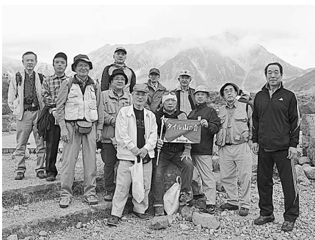
室堂高原にて立山連峰を望む

「タイル山の会」は、東京都タイル煉瓦工事工業協同組合、東京都タイル技能士会、神奈川県タイル建築協会、能士会などの有志でできた山歩きを愛好する親睦の会です。9月21日(土)〜22日(日)に毎年恒例の山歩きに行ってきました。第15回目を迎える今回の参加者は男性12名、コースは、「大自然の息吹を体感し、何度でも訪れたい黒部・立山の絶景散策と白馬山麓・黒部高原のホテルに泊る」の山旅でした。 アルプスの山々をのぞむ秘境・黒部峡谷と大自然の宝庫・室堂―黒部・立山アルペンルートを巡る今回の山の会は、新幹線利用のお得な阪急交通社のパッケージツアーに申し込みました。『新幹線利用!黒部立山アルペンルート・トロッコ列車を8つの乗物で巡る旅の2日間』という秘境絶断のプランです。