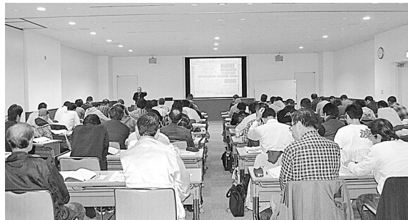
基幹技能者講習のよう

一般社団法人日本タイル煉瓦工業会(日夕煉)では、第1回登録タイル張り基幹技能者講習の受講申込を8月から受け付け、9月30日を受講申込を締め切ったところ、全国から67名の受講申込があったという。 講習委員会で受講申込のあった67名の資格審査が行われ、審査をパスした64名が登録タイル張り基幹技能者の資格認定に挑むことになった。 第1回講習会は10月26日