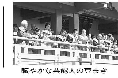
賑やかな芸能人の豆まき