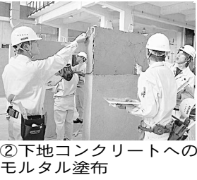
②下地コンクリートへのモルタル塗布