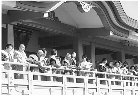
大盛況の高幡不動

平成25年2月3日(日)、当組合が創立15周年を記念して建立いたしました記念碑が同境内にあり、高幡不動の恒例の節分会に参加してきました。 毎年役員、組合員の年男の皆さんが参加しますが、仕事の都合で参加できない方もいて、写真の6名での参拝となりました。