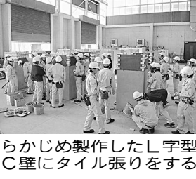
あらかじめ製作したL字型RC壁にタイル張りをすす