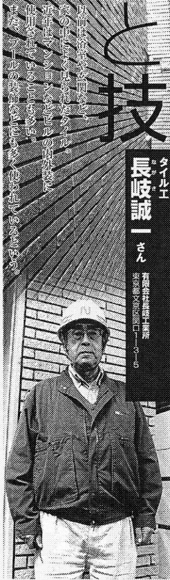
Terra 2013.2 ● ● ●

「我が社はプールのタイル...」 タイルは近年では建築物の外装、内装に使用される機会が多くなりました。製品は大きく分けて磁器質、陶器質、素焼きの風合いを持つセラミック質に分かれます。外装には吸水性の低い磁器質とセラミック質が使われ、内装には吸水率の高い陶器質が使われることが多いです。現在はガラス質のものも増えてきています。基本的にはタイルの裏面に接着剤を塗って施工しますが、最近では「50mm×50mm×12mm」の薄型タイルが30センチメートル角のシートになっているものも出てきています。 我が社はプールのタイル貼りに独自の技術を持っています。最近オープンした超高級ホテルでもいくつかの仕事をしました。たとえば浴室をイメージした、すべてが曲面で構成された浴室のタイル貼りに挑戦しました。